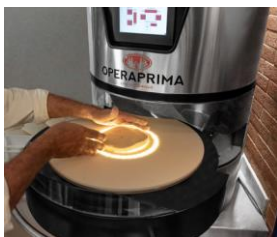
MARANA FORNI BY SOPRO